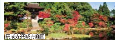
円成寺・円成寺庭園