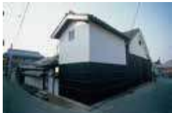
家プロジェクト「角屋」

古い家屋、神社などを改修し、アーティストが家の空間そのものを作品化したプロジェクト。