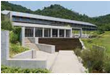
ベネッセハウス パーク