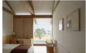
ベネッセハウス パーク 客室