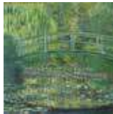
クロード・モネ「睡蓮の池」