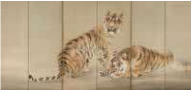
大橋禪石「虎図屏風」(右隻部分) 明治時代19世紀末～20世紀初頭 岡田美術館蔵

「東西の日本画 一大観・春草・松園など」 東京と京都の画家を中心に、近代の日本画約45件を紹介。横山大観の大作「霊峰一文字」、上村松園による美人画の代表作「汐くみ」など同館屈指の名品が一堂に会します。また、没後110年にちなみ、菱田春草作品全7件も一挙に公開。繊細で清らかな絵画世界をご堪能ください。