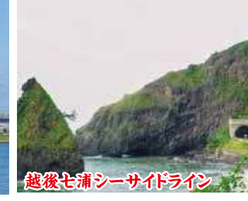
越後七浦シーサイドライン