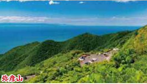
弥彦山 彌彦神社 弥彦山をご神体とする「二礼四拍手一礼」の神社。「4拍手」する神社は「出雲大社」と「宇佐神宮」が有名です。

明治時代には日本一人口が多かったのが新潟県、さすがは米どころ、酒どころ。また、海に山に美しい絶景の宝庫で神社数は約4700社で日本一。歴史を紐解くと…新潟県付近は古代の高志一越(こし)の国の東端に位置し蝦夷の領域に接する辺境国の地でありましたが旧石器時代から縄文にかけて輝かしい文明が華開いたことは世界に類を見ない火炎土器が証明します。戦後時代には軍神と崇められた上杉謙信、幕末は日本のラスト侍と称される河井継之助、連合艦隊司令長官・山本 五十六、そして元総理・田中角栄氏などこの地から様々な人物が輩出されました。さて、どんなビックリが貴方様を待ち受けているか発見しましょう。