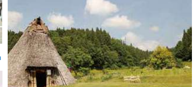
十日町笹山遺跡 ■十日町市博物館…2020年6月開館。笹山遺跡の国宝の火焰型土器の展示を始め縄文時代遺跡の宝庫と言われる十日町一帯からの貴重な出土品。 ■笹山遺跡…縄文時代中期前葉(約5,500年前頃)から始まった遺跡からは13基の竪穴住居跡を始め、炉跡、埋設土器等が発見され環状または馬蹄形状に配列。火焰型土器は、「新潟県笹山遺跡出土深鉢型土器」として国宝に指定されています。