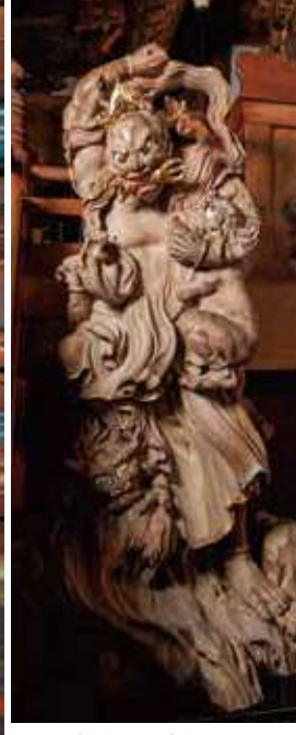
西福寺(開山堂) 三間四方の天井に挿られた庄巻の大彫刻。