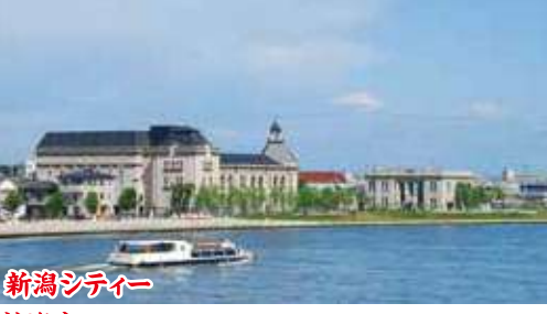
新潟シティー 新潟市 本州日本海側唯一の政令指定都市であり人口は約80万人。南海ホークスが舞台の人気漫画「あぶさん」の出身地として有名。