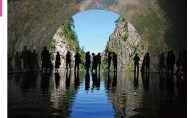
マヤンソン / MADアーキテクト「Tunnel of Light」(大地の芸術祭作品) 日本三大峡谷 清津峡 世にも珍しいトンネルから眺める、日本で一番の人氣急上昇スポット。