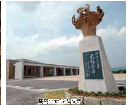
馬高(うまたか)縄文館