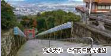
高良大社

～ふるさと巡礼～全国一の宮めぐり 特別編 歴史神社ガイド同行 1泊2日新幹線利用 ゆったり バス席1人二席利用の「ダブルシート」プラン ※大島島内を除く ひぜん つくしのくに むなかたおおしま むなかたさんしょん 肥前筑紫国一の宮5社と神宿る島「宗像大島」&宗像三女神まいり 18名様限定