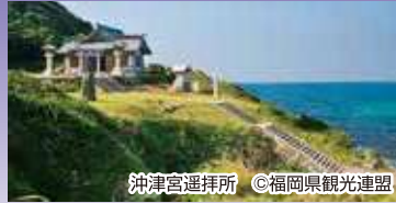
沖津宮遷拝所