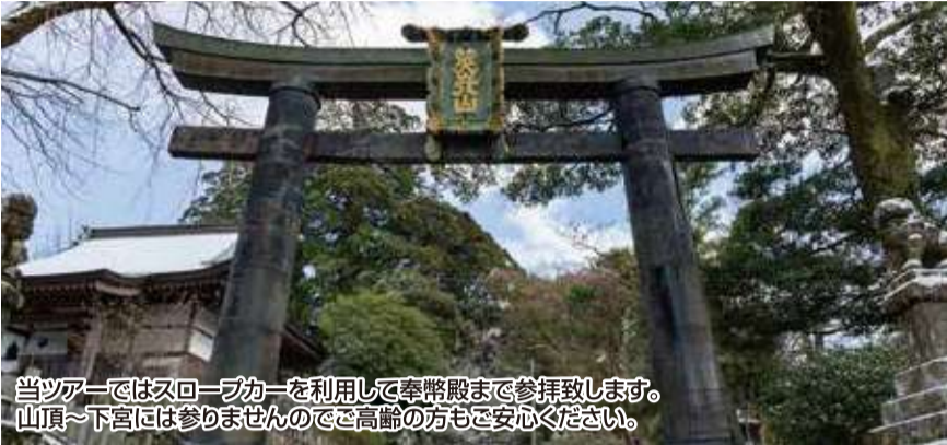
当ツアーではスロープカーを利用して奉幣殿まで参拝致します。 山頂～下宮には参りませんのでご高齢の方もご安心ください。

古代史の謎がこの地で解き明かされる... 出羽の羽黒山、熊野の大峰山と並び称される日本三大修験道・霊場、英彦山。古来から神の山として信仰されていた霊山で、御祭神は天照大神(アマテラス)御子である天忍穗耳命(アメノオシホミ)。ここから「日の子の山」、転じて「日子山」(ひこやま)→英彦山となったのです。天孫降臨の本当の謎がここに見え隠れないでしょうか。